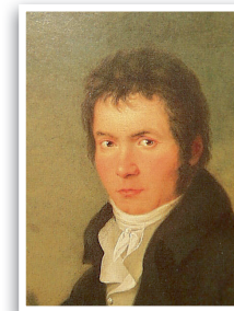
Beethoven, málverk frá u.þ.b. 1804., eftir Willibrod Josef Mahler.