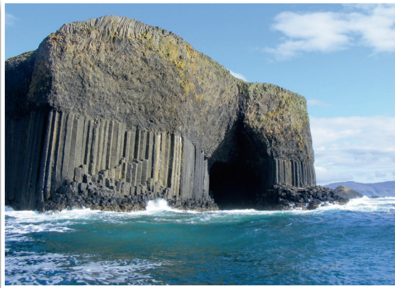
Fingalshellir á Staffa

Felix Mendelssohn–Bartholdy (1809–1847): Þegar Mendelssohn var tvítugur, árið 1829, lagði hann upp í för um Vestur-Evrópu til að útvíkka hugann, heyja sér reynslu og stofna til kynna við góða menn. Í þeirri för urðu til kím ýmissa verka hans, svo sem Ítölsku sinfóniunnar og Skosku sinfóniunnar, svo og forleiksins sem nú er fluttur, Fingalshellir. Hellir Fingals er á smáeyjunni Staffa, sem er ein af Suðureyjum vestan við Skotland. Þetta er stuðlabergshellir ekki ólíkur Garðahelli sunnan í Reynisfjalli í Mýrdal sem margir kannst við. Þótt tónskáldið væri illa haldið af sjóveiki og þætti hellirinn ógnvekjandi, skráði hann þegar upphafið að forleiknum í dagbók sína. Verkinu lauk hann á Ítalíu ári síðar. Forleikurinn var frumfluttur í London 1832 og hefur jafnan notið vinsælda síðan.