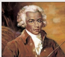
Le Chevalier de Saint-Georges